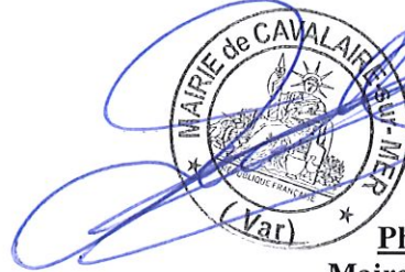
Philippe LEONELLI Maire de Cavalaire-sur-Mer

La présente décision est transmise au représentant de l'Etat dans les conditions prévues à l'article L.2131-2 du code général des collectivités territoriales.